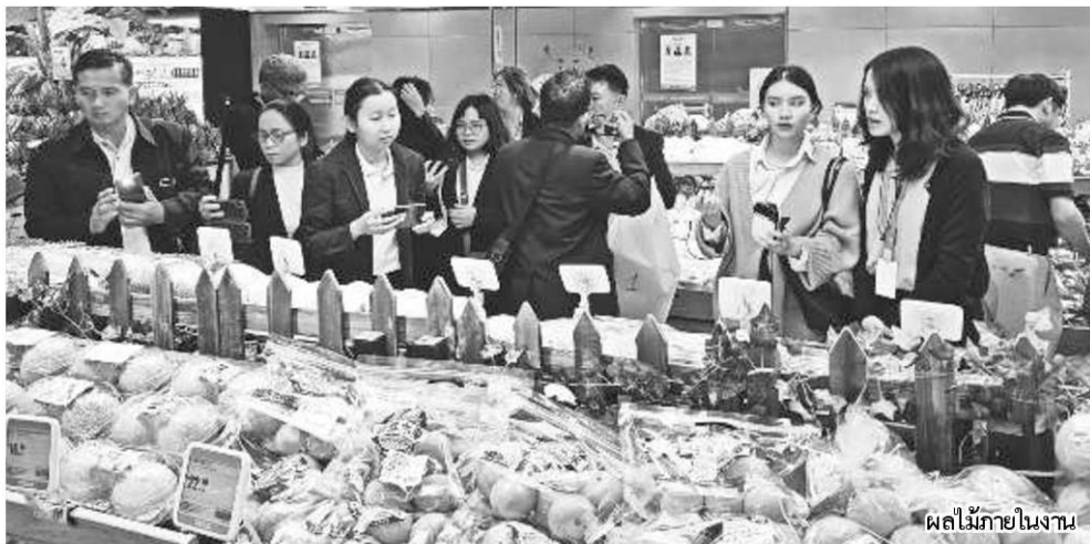
ผลไม้ภายในงาน

งานใหญ่ ระดับโลกที่คนเกษตรไม่ควรพลาด สำหรับงานมหกรรมแสดงพืชสวนระหว่างประเทศปักกิ่ง เอ็กซ์โป 2019 (The International Horticultural Exhibition 2019 : Beijing Expo 2019) ภายใต้แนวคิด “Live Green, Live Better” จัดขึ้นระหว่างวันที่ 29 เมษายน-7 ตุลาคม ณ กรุงปักกิ่ง สาธารณรัฐประชาชนจีน โดยประเทศไทยเป็นส่วนหนึ่งของการงานในครั้งนี้ บนพื้นที่กว่า 1,600 ตารางเมตร ประกอบด้วย ไทยแลนด์ พาววิลเลียน (บ้านไทย) อาคารแสดงสินค้าและบริการข้อมูลประเทศไทย (บ้านไทย) สร้างขึ้นภายใต้แนวคิด The Green Way of Life, the Thai Way of Sufficiency พื้นที่ 1,600 ตารางเมตร แสดงให้เห็นถึงการประยุกต์ใช้หลักปรัชญาเศรษฐกิจพอเพียงกับวิถีชีวิตของคนไทยและวัฒนธรรมไทย ผ่านบ้านไทยโบราณและสวนไทยด้วยแนวคิด “ซูเปอร์มาร์เก็ตรอบบ้าน” มีการเพาะปลูกพืชผัก ไม้ผล พืชสมุนไพร และไม้ดอกไม้ประดับที่หลากหลายเพื่อการบริโภคในครัวเรือนและสร้างรายได้จากการจำหน่ายผลผลิตสู่ตลาด