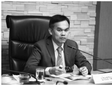
นายฉันทานนท์ วรรณเขจร รองเลขาธิการ

สำนักงานเศรษฐกิจการเกษตร (สศก.) ร่วมมือกับการยางแห่งประเทศไทย (กยท.) ทำโครงการศึกษาวิจัยต้นทุนการผลิตยางของเกษตรกรไทย ปี 2562 เพื่อสำรวจข้อมูลด้านปริมาณการผลิตและต้นทุนการผลิตยางพาราของเกษตรกรไทยทั่วประเทศ